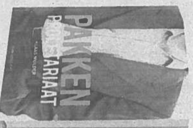
Pakkenproletariaat , Klaas Mulder, IS'VV uitgeverij, 323 blz., €24,50.